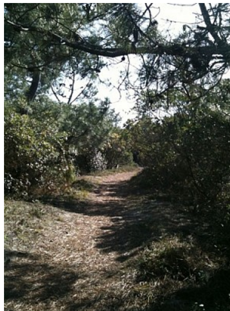
Office de Tourisme de Lège-Cap Ferret

Avenue de Bordeaux Cap Ferret33970 LÈGE-CAP-FERRET