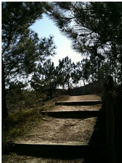
Office de Tourisme de Lège-Cap Ferret